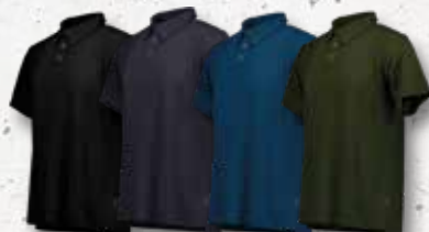
Black Navy Estate Olive Blue