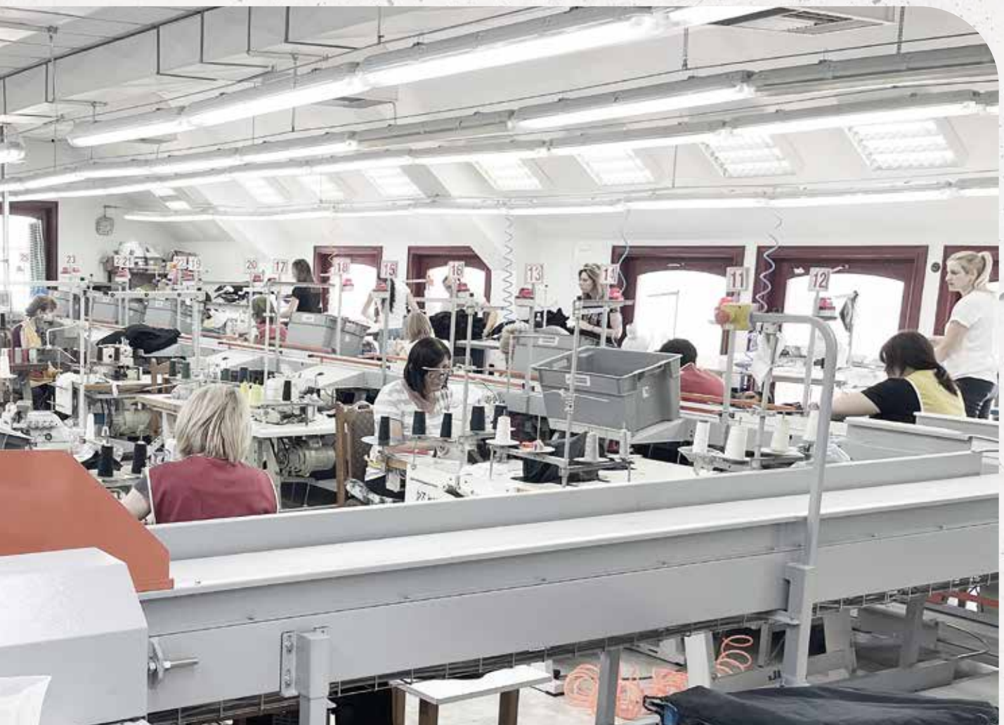
Image Kompagniet hat einen spezifischen Verhaltenskodex, dem alle Lieferanten folgen müssen. Um die Verantwortung in unserer Lieferkette zu gewährleisten, haben wir einen Ingenieur angestellt, der sich ausschließlich auf Gesetzgebung und Corporate Social Responsibility (CSR) konzentriert.

Bei Image Kompagniet ist es uns sehr wichtig, eng mit unseren Lieferanten zusammenzuarbeiten. Das hilft uns sicherzustellen, dass unsere hochwertigen Produkte unter Beachtung von Mensch und Umwelt produziert werden.