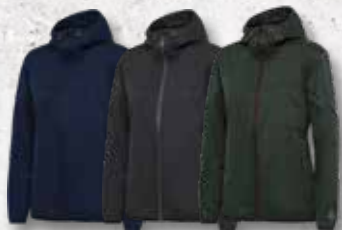
Navy Black Olive