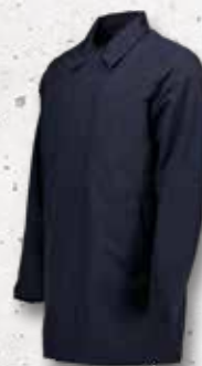
Mac Coat HERREN 011003