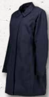
Mac Coat DAMEN 012003