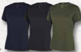
Navy Black Olive