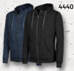
Navy Black Melange Melange