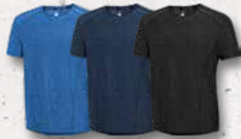
Azure Melange Navy Melange Black Melange