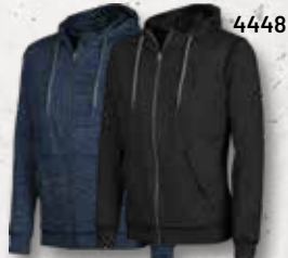
Navy Black Melange Melange