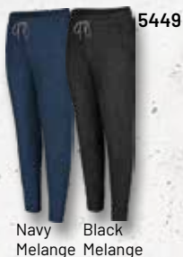
Navy Melange Black Melange