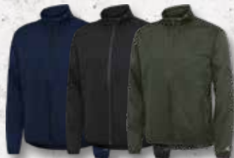
Navy Black Olive