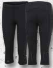
3/4 LENGTH 5497