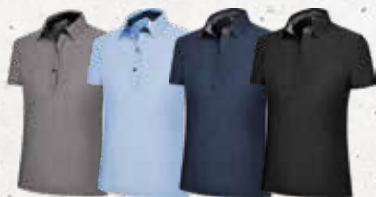
Grey LightBlue Navy Black Melange Melange Melange Melange