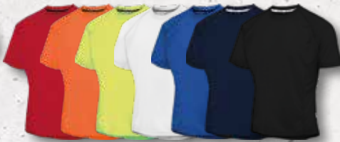
Red Orange Fl. White Azure Navy Black Yellow