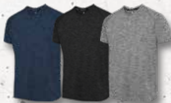
Navy Melange Black Melange Grey Melange