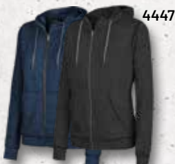
Navy Black Melange Melange