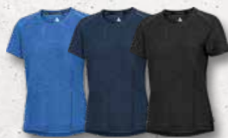
Azure Melange Navy Melange Black Melange