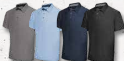
Grey LightBlue Navy Black Melange Melange Melange Melange