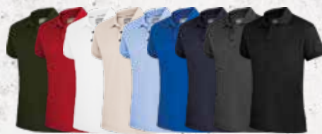
Olive Red White Sand Light Azure Navy Anthra- Black Blue cite