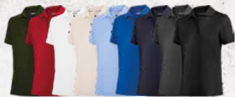
Olive Red White Sand Light Azure Navy Anthra- Black Blue cite