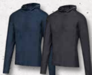
Navy Black Melange Melange