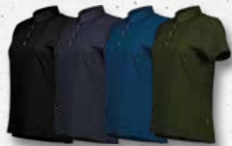
Black Navy Estate Olive Blue