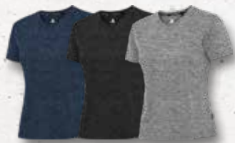
Navy Melange Black Melange Grey Melange