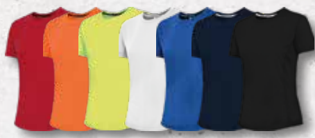
Red Orange Fl. White Azure Navy Black Yellow