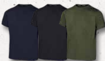
Navy Black Olive