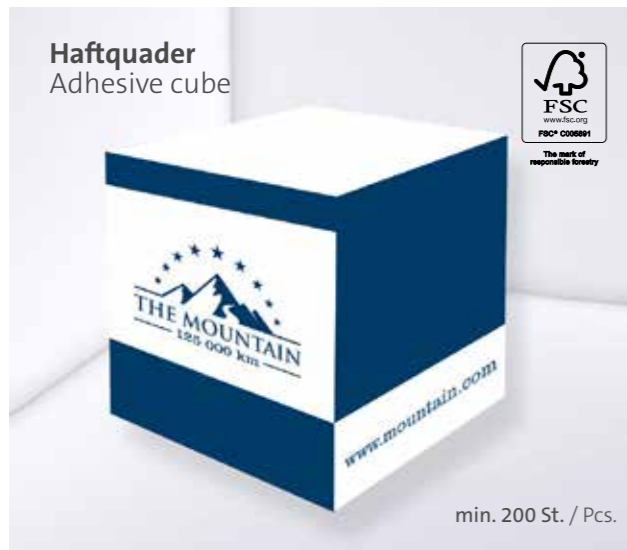
Haftquader Adhesive cube