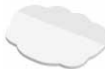
Wolke Cloud , 85,5 x 67 mm