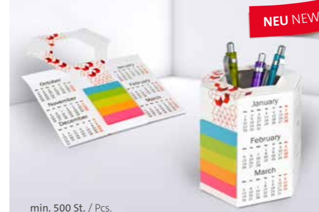
Office Organizer 06 Office organizer 06

Tidy and within easy reach: our cardboard note box is available in a range of shapes and sizes, printed as required, and totally customisable. Whether you want a standard shape or unusual shape – the advertising classic works.