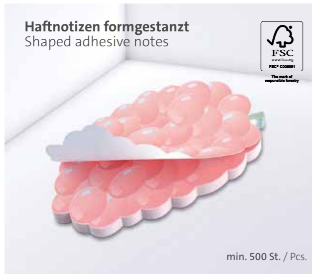
Haftnotizen formgestanzt Shaped adhesive notes