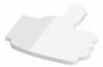
Daumen Thumb , 72 x 67 mm