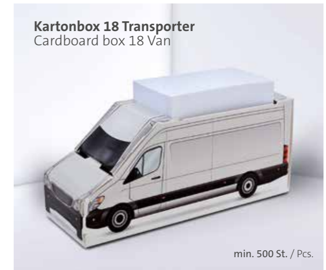
Kartonbox 18 Transporter Cardboard box 18 Van

Individuelle Formen auf Anfrage Individual shapes on request