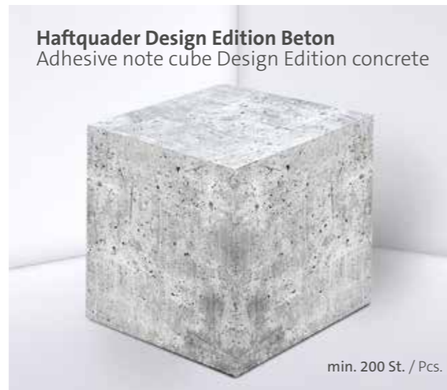
Haftquader Design Edition Beton Adhesive note cube Design Edition concrete