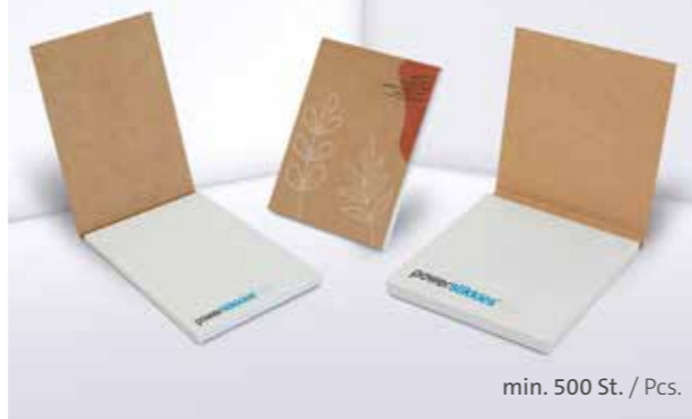
PURE notes Haftnotizen im Kartonumschlag PURE notes adhesive notes with cardboard cover