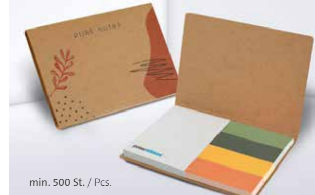
PURE notes Haftset 01 mit individualisierbaren Papiermarkern PURE notes adhesive set 01 with individual paper marker