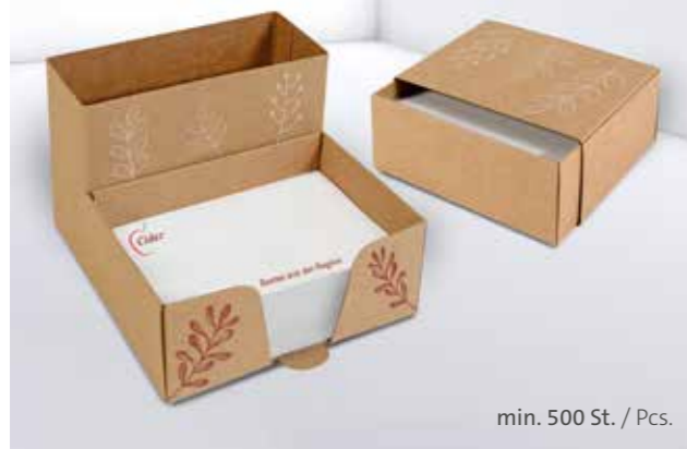
PURE notes Kartonbox PURE notes cardboard box

Little things can often make a big difference. Which is why the PURE notes series is a perfect addition to the more environmentally-friendly and climate-conscious lifestyle that so many consumers are striving for. Every PURE notes product is made from recycled paper and PEFC-certified cardboard and is completely plastic-free. The renewable materials used and the pleasant, natural feel of the finish make PURE notes products an ideal promotional medium for companies that are committed to environmental protection and sustainability.