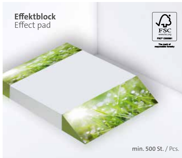
Effektblock Effect pad

Ohne Kugelschreiber, optional mit gestelltem Kugelschreiber erhältlich Without ballpoint pen, optionally available with a posed ballpoint pen