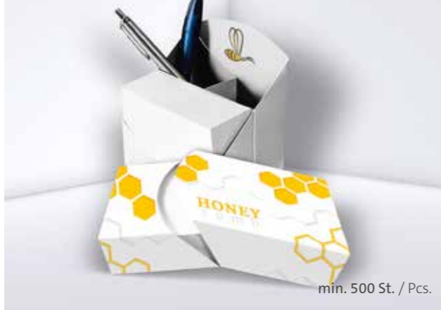
Kartonbox 08 Cardboard box 08