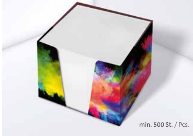
Kartonbox 01 Cardboard box 01