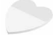
Herz Heart , 63 x 65 mm