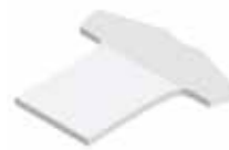
Shirt Shirt , 77 x 70 mm