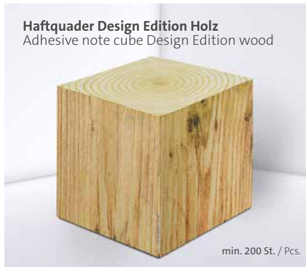
Haftquader Design Edition Holz Adhesive note cube Design Edition wood

The PURE notes adhesive set 04 is both practical and eco-conscious. It is perfect for all important notes, and the paper markers are fully customizable. Sustainable materials such as recycled paper are used, providing a high-quality and natural feel that perfectly completes the overall image.