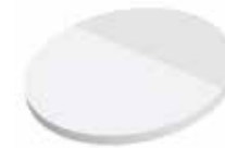
Kreis Circle , 63 x 63 mm