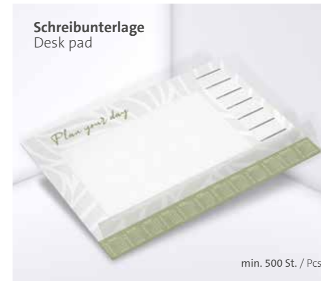
Schreibunterlage Desk pad