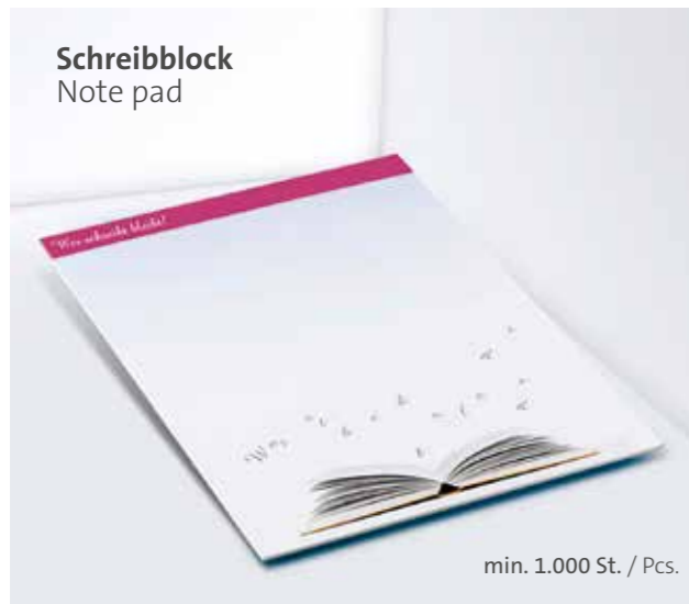
Schreibblock Note pad