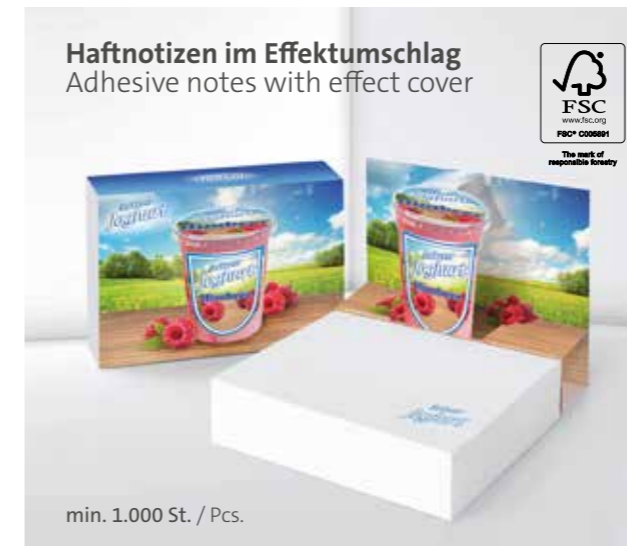
Haftnotizen im Effektumschlag Adhesive notes with effect cover

Unterstrichenes Maß = Haftseite Underlined dimension = Adhesive side