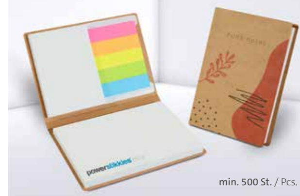
PURE notes Haftset 04 mit Papiermarker PURE notes adhesive set 04 with paper marker set