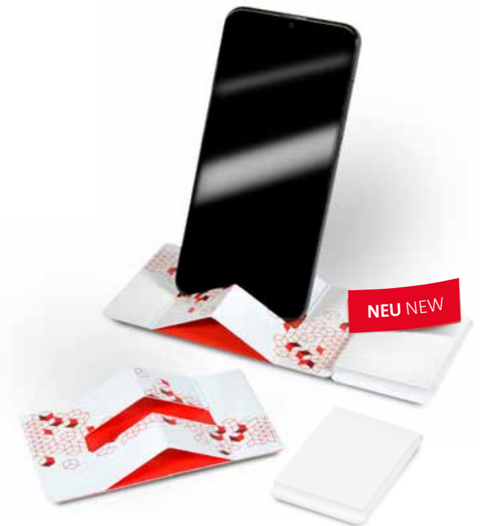
Haftset 27 mit Smartphonehalter Adhesive set 27 with Smartphone holder