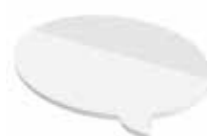
Sprechblase Speech balloon , 98 x 65 mm