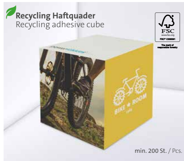
Recycling Haftquader Recycling adhesive cube