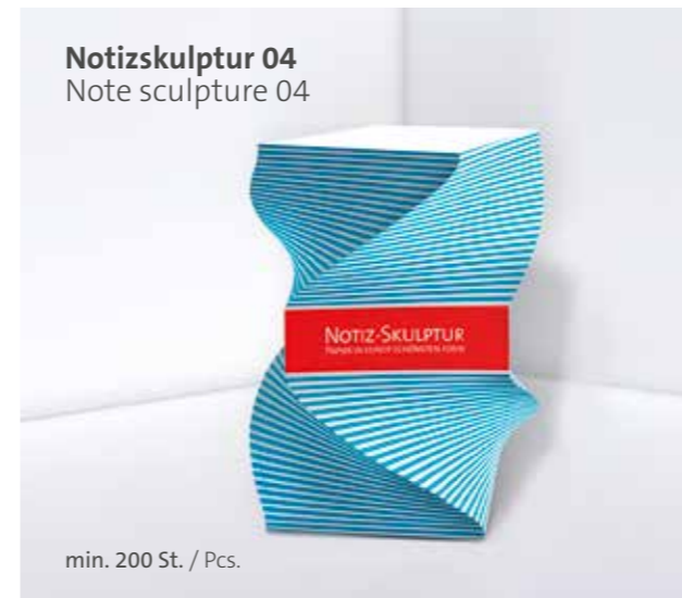
Notizskulptur 04 Note sculpture 04

Optional Einzelblattdruck 1- bis 4-farbig Offset Optional single-sheet print 1- up to 4-coloured offset