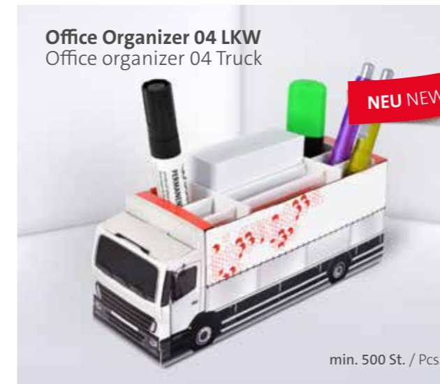
Office Organizer 04 LKW Office organizer 04 Truck