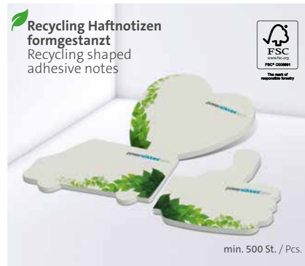
Recycling Haftnotizen formgestanzt Recycling shaped adhesive notes