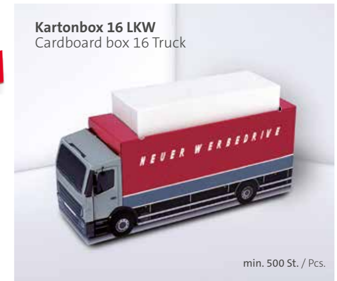
Kartonbox 16 LKW Cardboard box 16 Truck

Weitere Formen wie bspw. Bus auf Anfrage Individual shapes like Bus on request