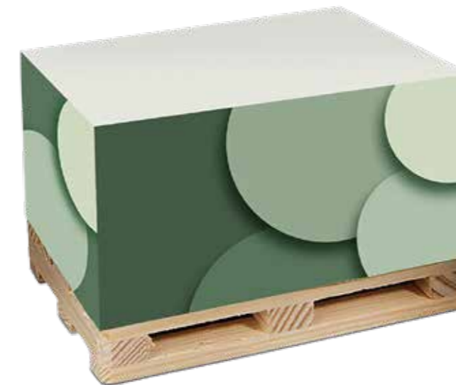
Recycling Palettenquader Recycling pallet cube

Optional Einzelblattdruck 1- bis 4-farbig Offset Optional single-sheet print 1- up to 4-coloured offset