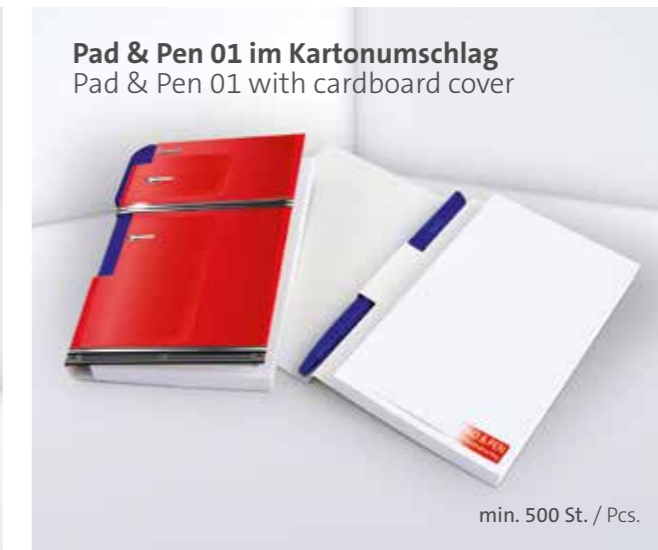
Pad & Pen 01 im Kartonumschlag Pad & Pen 01 with cardboard cover

Optional mit transparenter oder weißer Kunststoffleiste Optional with transparent or white plastic border