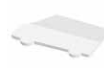
Lieferwagen Van , 94 x 52