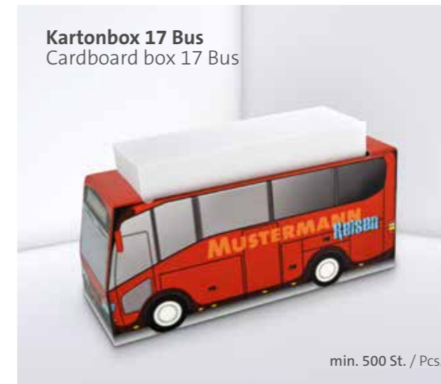
Kartonbox 17 Bus Cardboard box 17 Bus