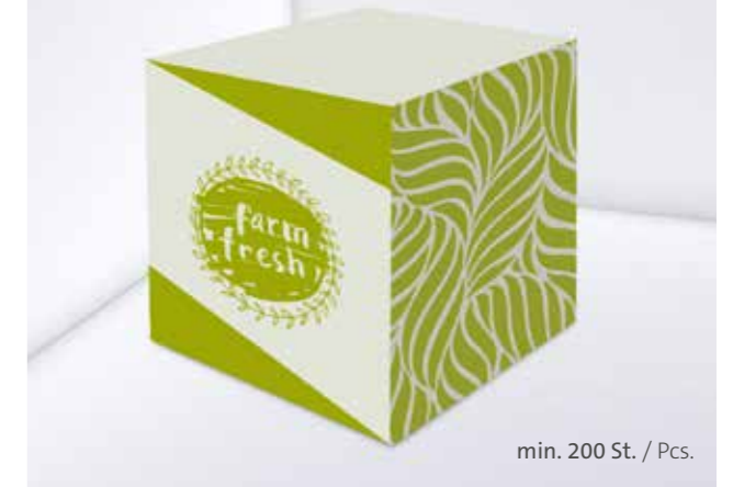
Recycling Notizquader Recycling note cube

Optional Einzelblattdruck 1- bis 4-farbig Offset Optional single-sheet print 1- up to 4-coloured offset