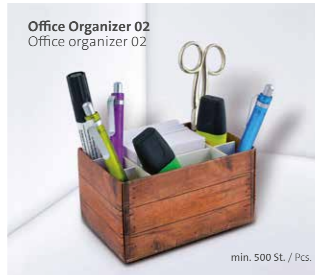
Office Organizer 02 Office organizer 02