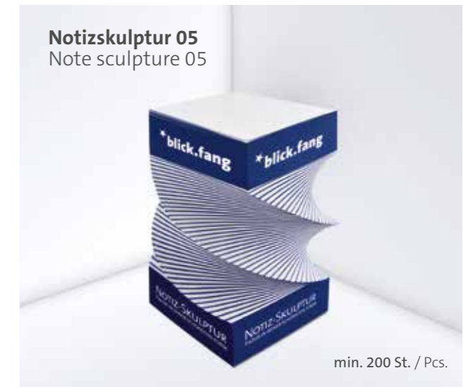
Notizskulptur 05 Note sculpture 05

Optional Einzelblattdruck 1- bis 4-farbig Offset Optional single-sheet print 1- up to 4-coloured offset