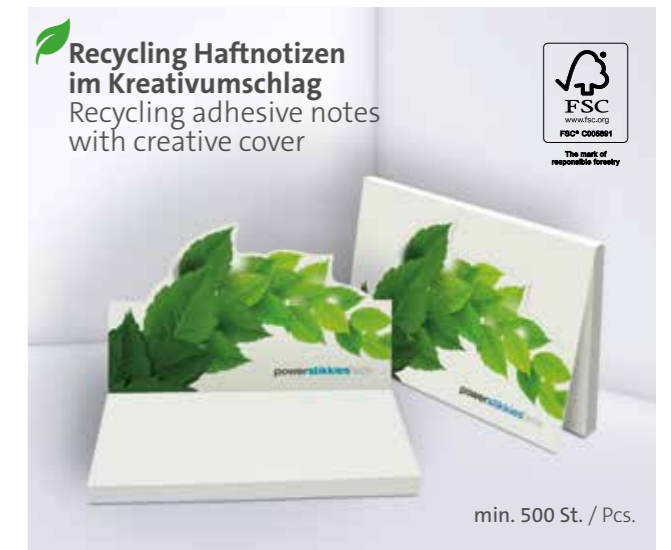
Recycling Haftnotizen im Kreativumschlag Recycling adhesive notes with creative cover