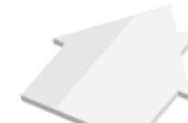
Haus House , 75 x 69 mm