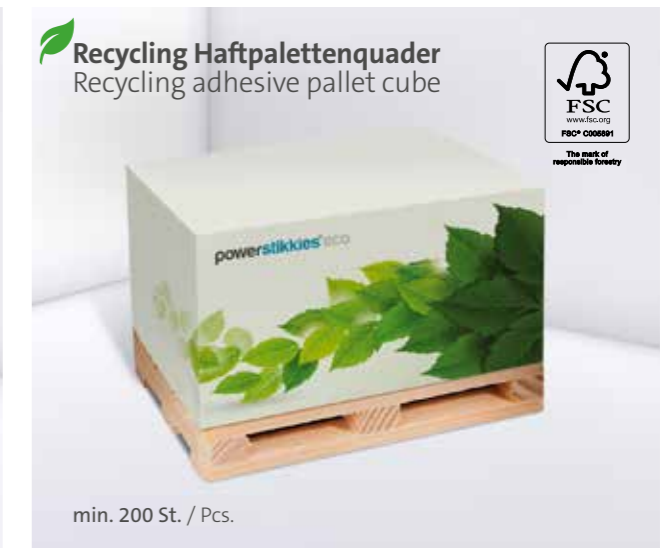
Recycling Haftpalettenquader Recycling adhesive pallet cube

*Zzgl. Holzpalette (ca. 15 mm)/ plus wooden pallet (approx. 15 mm)