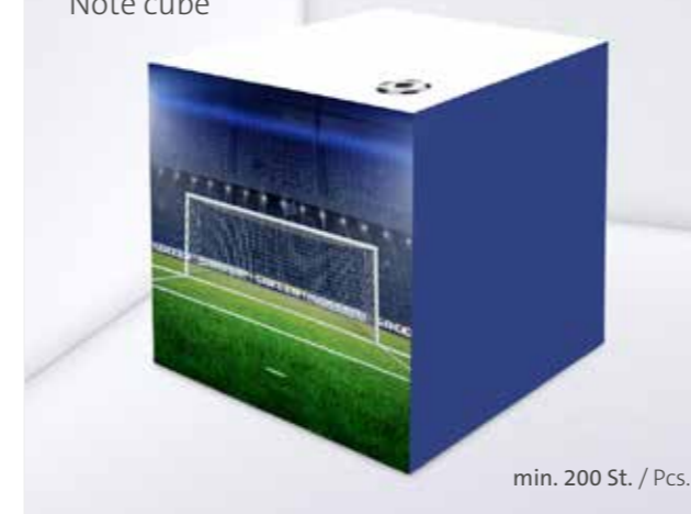
Notizquader Note cube

This is how we use cubes! Printed all around with the design of your choice, staged as a sculpture, punched or with an integrated pen – we offer note pads in many shapes and sizes, fully customisable.