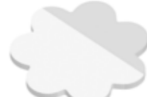
Blume Flower , 65 x 65 mm