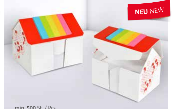
Kartonbox 10 Haus Cardboard box 10 House