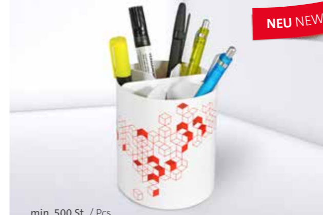
Office Organizer 05 Office organizer 05

Auch mit individualisierbarem Papiermarker set erhältlich Also available with individual paper marker set