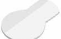
Glühbirne Light bulb , 95 x 62 mm