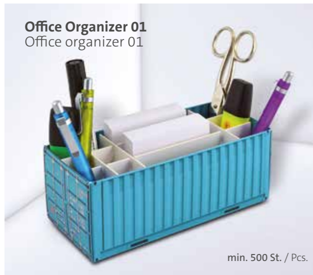
Office Organizer 01 Office organizer 01