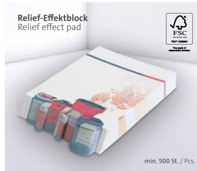
Relief-Effektblock Relief effect pad