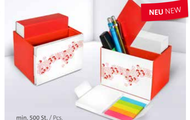
Office Organizer 03 Office organizer 03