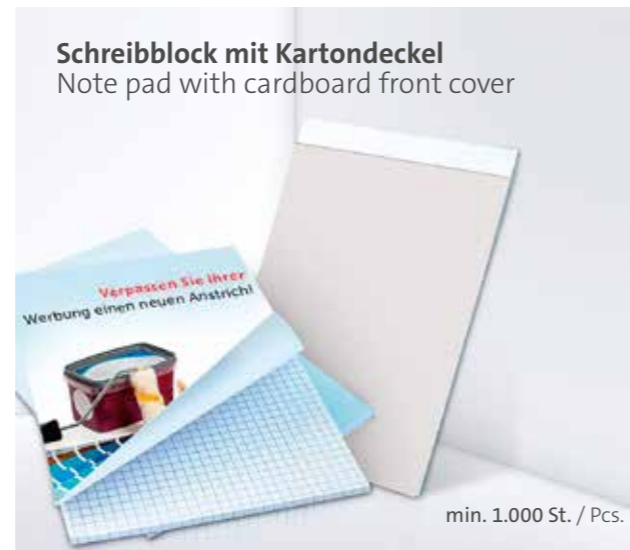
Schreibblock mit Kartondeckel Note pad with cardboard front cover