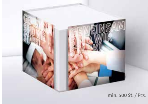
Kartonbox 07 Cardboard box 07