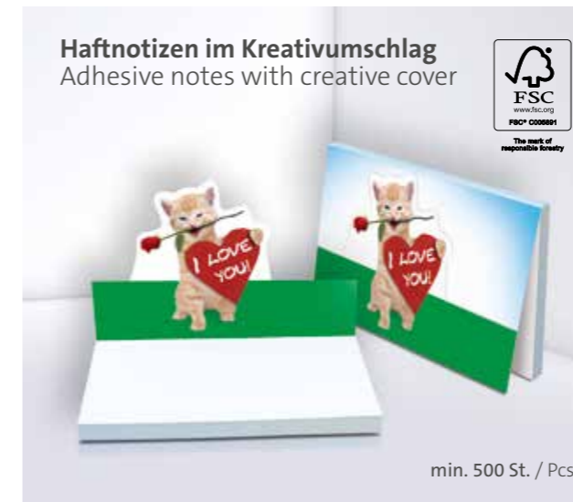
Haftnotizen im Kreativumschlag Adhesive notes with creative cover