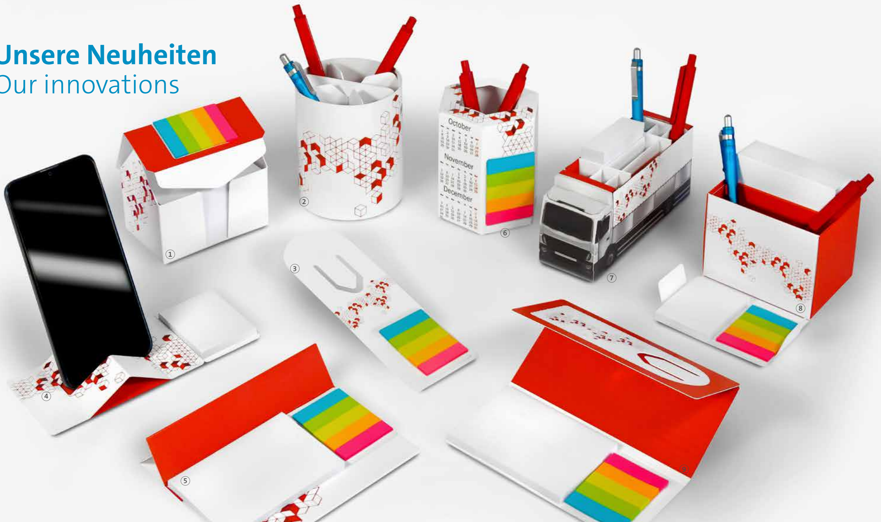
① Kartonbox 10 Haus Cardboard box 10 House Seite 43 page 43