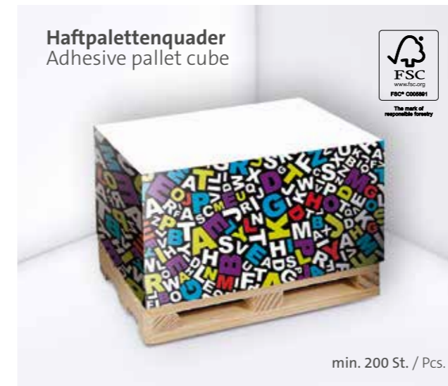
Haftpalettenquader Adhesive pallet cube