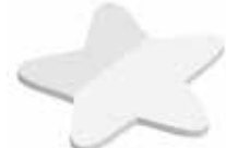
Stern Star , 70 x 70 mm