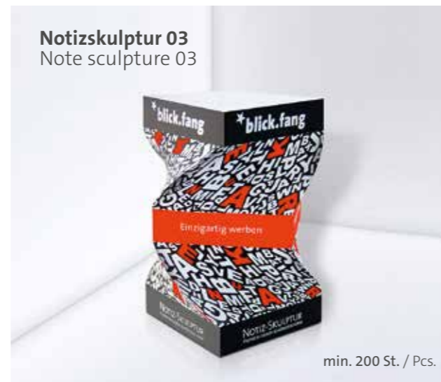
Notizskulptur 03 Note sculpture 03

Optional Einzelblattdruck 1- bis 4-farbig Offset Optional single-sheet print 1- up to 4-coloured offset