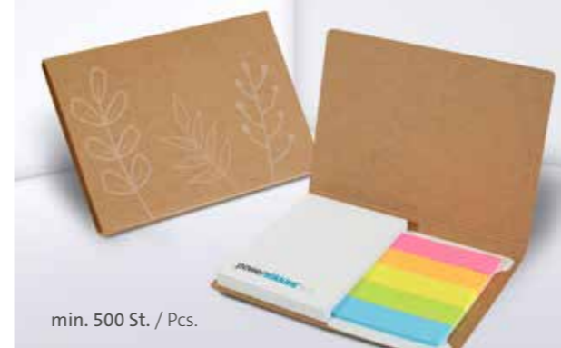
PURE notes Haftset 01 mit Papiermarker PURE notes adhesive set 01 with paper marker set

Unterstrichenes Maß = Haftseite Underlined dimension = Adhesive side