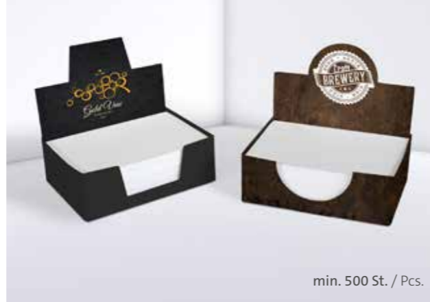
Kartonbox 09 Cardboard box 09