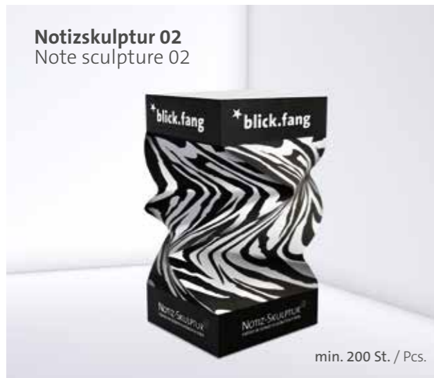
Notizskulptur 02 Note sculpture 02

Optional Einzelblattdruck 1- bis 4-farbig Offset Optional single-sheet print 1- up to 4-coloured offset