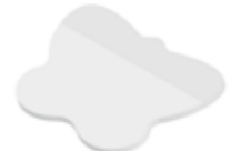
Schmetterling Butterfly , 97 x 69 mm

Unterstrichenes Maß = Haftseite Underlined dimension = Adhesive side