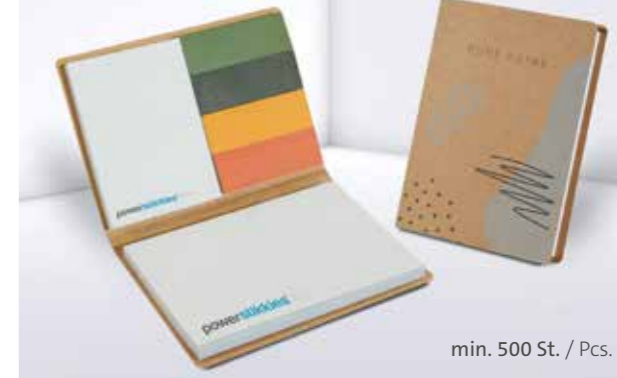
PURE notes Haftset 04 mit individualisierbaren Papiermarkern PURE notes adhesive set 04 with individual paper marker